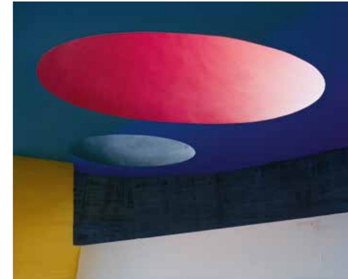
Margret Hoppe Unité d'Habitation IV, Marseille 2013, C-Print hinter Acrylglas, 120 x 100 cm, 2 Holzelemente Vorderseite →

Oftmals, wenn man die Gebäude betritt, wirken sie anfangs chaotisch, aber ich versuche sie immer als eine stimmige Komposition zu fotografieren, sodass der Betrachter den Sinn des Gebäudes begreift und versteht, dass es nicht nur eine Ruine ist, sondern ein Bauwerk, das eine echte Funktion und Bedeutung hatte. Letztendlich kannst du als Fotograf die Wertschätzung für und das Verständnis von Architektur beeinflussen.