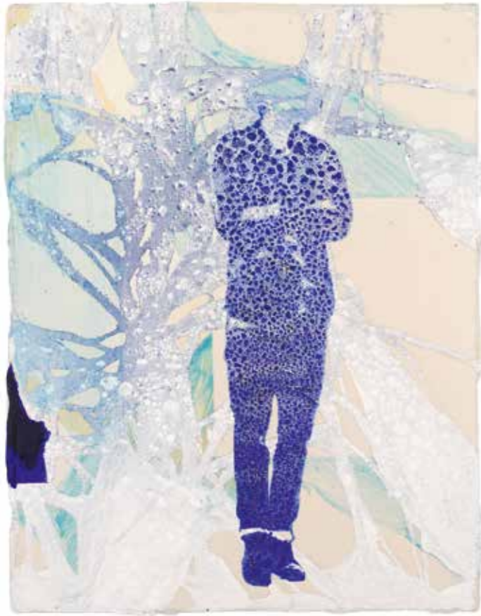
Christofer Kochs Belichtung des Jetzt (Termingeschäft), 2025, Lascaux, Öl auf Leinwand, 40 x 30 cm

Ein Bild ist immer Kommunikation. Es wird von mir gemacht und von jemandem fertig geschaut. Das ist das Faszinierende an Bildern.